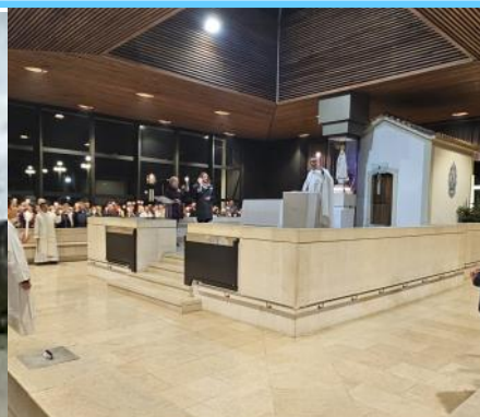
Kapela ukazanja - molitva krunice