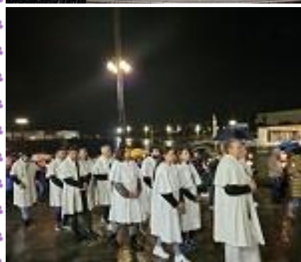
Naši muškarci i žene u procesiji