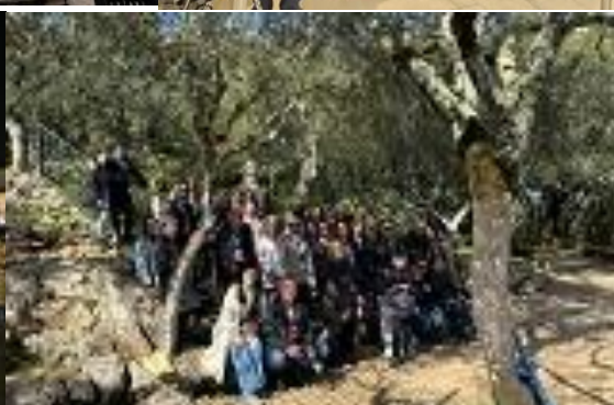
Valinhos - mjesto ukazanja anđela