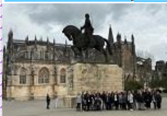
Batalha - crkva sv. Marije od pobjede