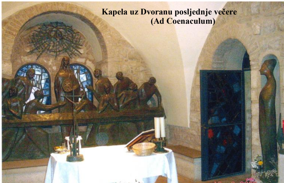
Kapela uz Dvoranu posljednje večere (Ad Coenaculum)

Majka Božja je Catalini objavila: "Ovdje sam nazočna sve vrijeme. Jamčim ti, ni na jednom mjestu, ni na jednom dijelu svijeta nisam toliko nazočna kao na Svetoj misi.