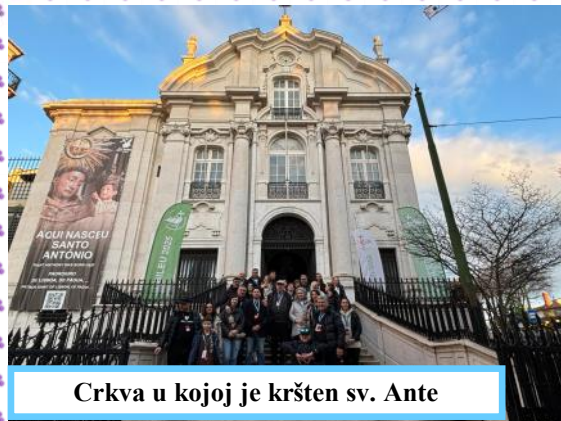
Crkva u kojoj je kršten sv. Ante